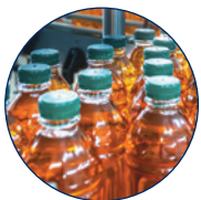
Lebensmittel- und Getränke