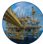
Öl und Gas